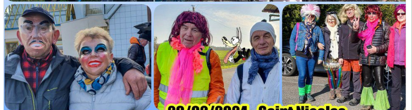
29/02/2024 - Saint Nicolas